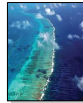
Vista aérea de la Barrera Arrecifal Mesoamericana, la segunda más grande del mundo y la más larga del Hemisferio Occidental. Se extiende a lo largo de 1.000 kilómetros por las costas orientales de México, Belice, Guatemala, y Honduras.

Para garantizar compatibilidad con otros esfuerzos existentes en la región, el ICRAN-MAR intenta coordinar con otras instituciones e iniciativas regionales tales como PROARCA, la CCAD, el proyecto SAM, The Nature Conservancy, Rain Forest Alliance, Conservation International, Wildlife Conservation Society, Dole, CropLife Latinoamérica y Chiquita ■